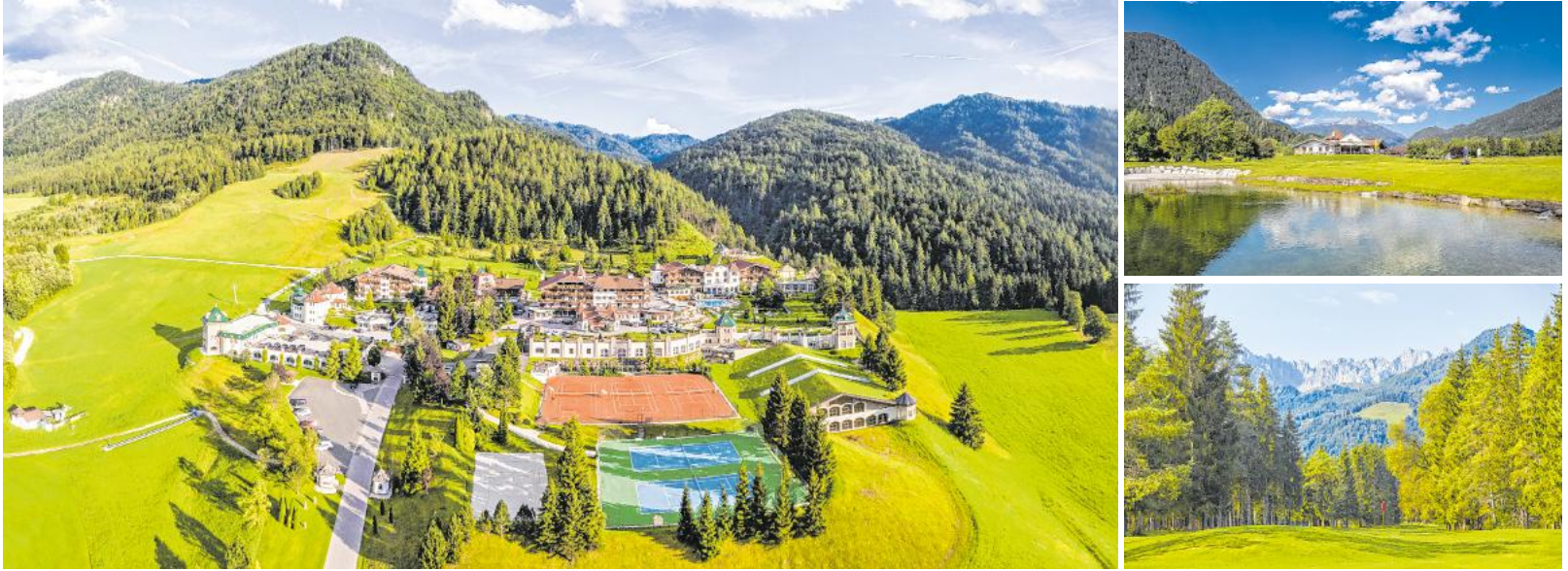
Golferherz, was willst du mehr: eine Mitgliedschaft, zwei Golfclubs und das 5-Sterne-Hotel „Der Lärchenhof“ nur wenige Kilometer von Kitzbühel entfernt.