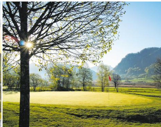
Der Golfclub Walchsee-Moarhof bietet entspanntes Golfen in herrlicher Lage. Er ist eingebettet in ein einzigartiges Hochmoorgebiet.