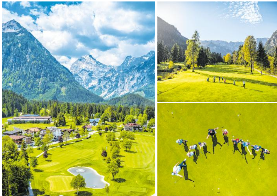
Die Alpenkulisse beim Spiel ist beeindruckend.

Besonders am Herzen liegt uns auch die Förderung von Kindern und Jugendlichen – damit schon die Jüngsten Spaß am Golfsport entdecken und die Begeisterung für den Golf und Landclub Achensee weitertragen.