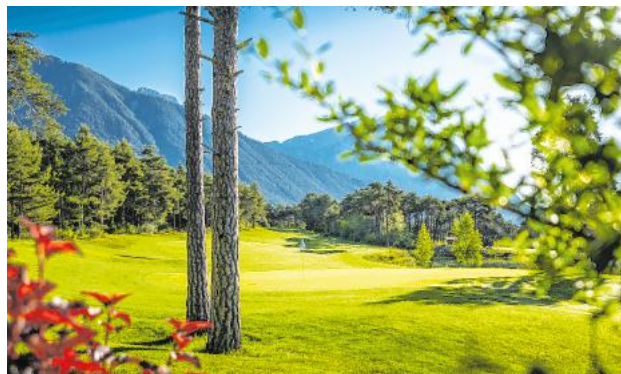
Eine Driving Range mit Ausblick und tolle Golfrunden auf den großzügigen Fairways des Golf Clubs Mieminger Plateau.