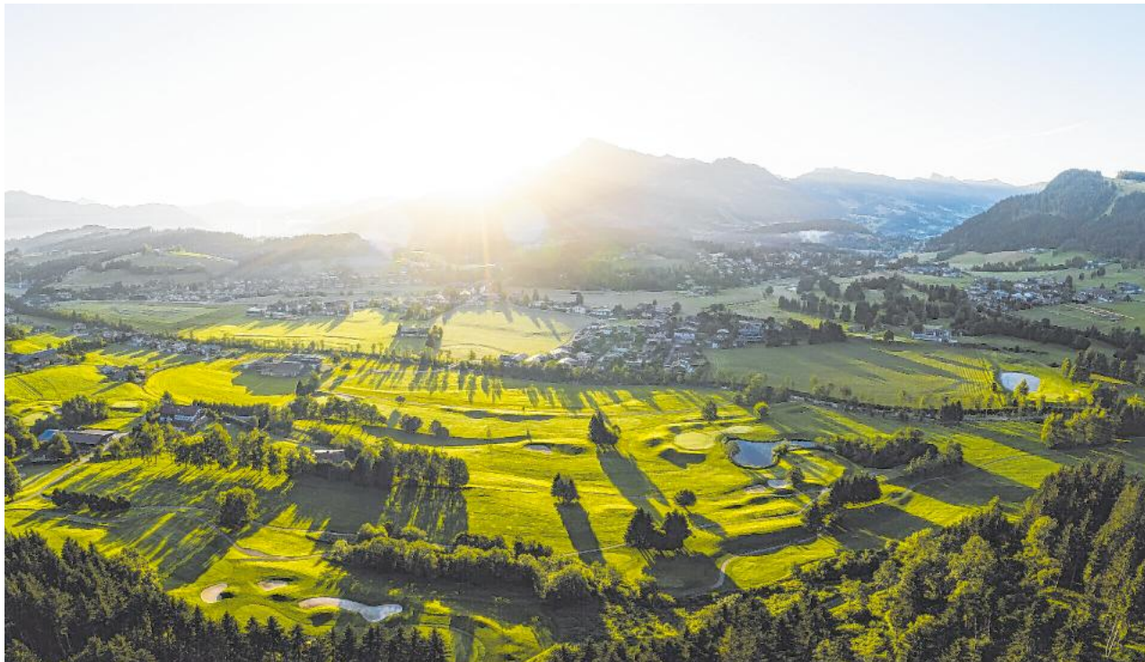
Der Golfplatz Kitzbühel-Schwarzsee-Reith ist bereit für die Austrian Alpine Open 2026.