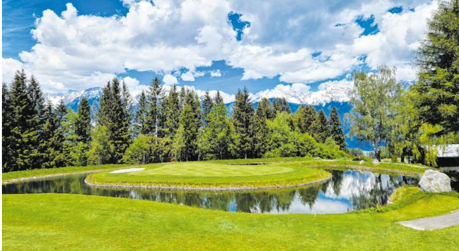
Der GC Innsbruck-Igls steht für Vielfalt, Flexibilität und Golfgenuss in bester Lage.

Mit dem 18-Loch Championship Course in Rinn und dem 9-Loch Parkland Course in Lans stehen zwei abwechslungsreiche Anlagen zur Verfügung. Beide Plätze bieten Clubhäuser, Gastronomie und Übungsbereiche, in Rinn zusätzlich eine Driving Range. Während Rinn sportliche Herausforderungen auf Top-Niveau bietet, überzeugt Lans mit idyllischer Lage und Einsteigerfreundlichkeit. Eine kurze Anfahrt sorgt für noch mehr Zeit am Platz.