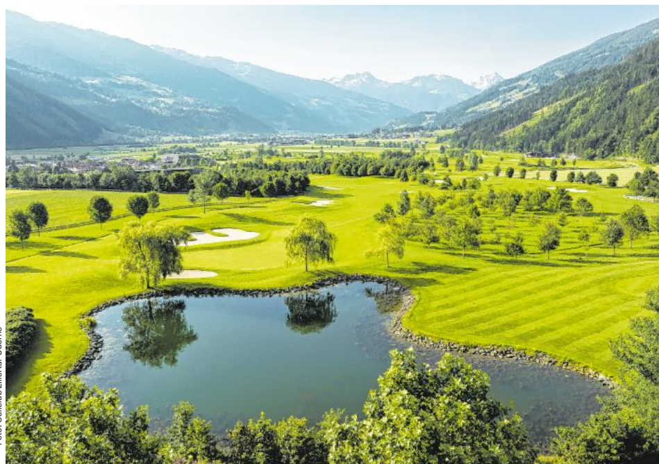
Vier Par-5-, zehn Par-4- und vier Par-3-Löcher sind im Angesicht eines prachtvollen Alpenpanoramas zu spielen.

Der 18-Hole-Meisterschaftsplatz bietet eine großzügig angelegte Übungsanlage mit überdachten Abschlägen, Kurzspielareal, Chipping- und Putting Area sowie PGA-Golfschule. Neu seit Sommer 2025 ist die Trackman Range an der Driving Range – hier können Schläge genau analysiert, spielerische Challenges gemeistert oder ganze Turniere gespielt werden. Die Lage des Golfclubs auf 550 Metern Seehöhe und die klimatischen Bedingungen ermöglichen eine Spielzeit von März bis November. Direkt am Platz präsentiert die Sportresidenz Zillertal das moderne Clubhaus „Genusswerkstatt“ mit großzügiger Sonnenterrasse für