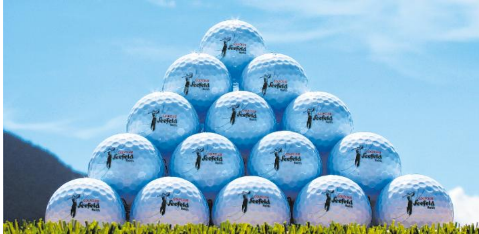
Zentrumsnah und familienfreundlich ist der GC Seefeld Reith.

Was das Areal zusätzlich auszeichnet: Die Hürden für Interessierte sind bewusst niedrig gehalten. Wer Lust hat, kann gegen ein Rangefee (Tageskarte) auf dem Übungsgelände und der Driving Range seine ersten Schwünge versuchen.