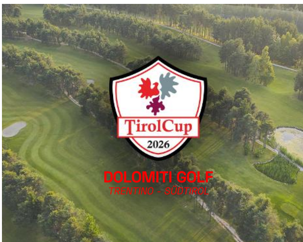
Der großzügige Platz besticht durch seine schöne Lage.

Am 4. Oktober 2026 wird der Dolomiti Golf der offizielle Austragungsort des