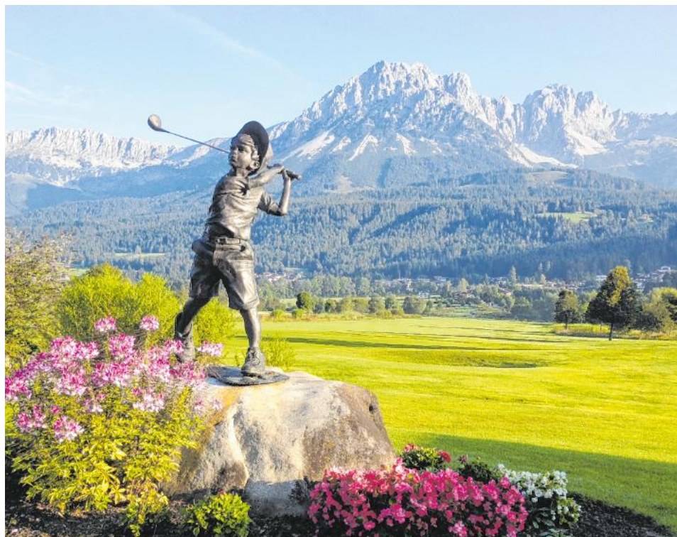
88 Hektar idyllisches Golfland – Golfplatz Wilder Kaiser in Ellmau.