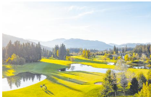
Ein Spiel in traumhafter Umgebung.

Der 18-Loch-Championship-Platz gehört seit 2022 zum exklusiven Kreis der Leading Golf Courses Austria und liegt idyllisch abseits der touristischen Hauptverkehrswege auf einem sonnigen Hochplateau in Westendorf. Der flache und angenehm begehbare Platz