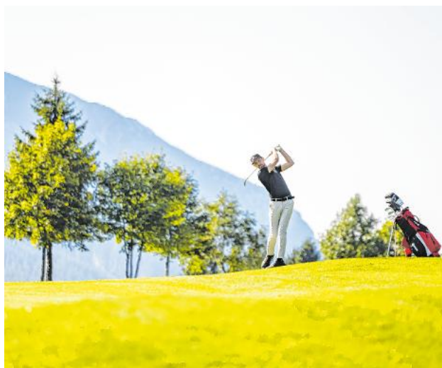
Die alpine Landschaft und der Panoramablick machen den Platz des GC Posthotel Alpengolf Achenkirch einzigartig.

Der schöne 9-Loch-Platz der Posthotel-Alpengolf-Anlage liegt auf einem Hochplateau, gleich oberhalb des Annakirchls, und grenzt unmittelbar an das Naturschutzgebiet des Karwendels. Unterschiedliche Abschläge und die abwechslungsreiche Gestaltung machen den Platz für jeden Golfer geeignet. Die alpine Landschaft und der Panoramablick machen den Platz so einzigartig. Übrigens: der einzige Golfplatz mit einem Gipfelkreuz auf genau 1000 m Meereshöhe. Zur Anlage gehören Driving-Range, Putting- und Chipping-Greens, Pitching-Gelände und natürlich das Clubhaus im denkmalgeschützten Dollenhof (1684). Ob drinnen in der gemütlichen Stube oder draußen auf der sonnigen