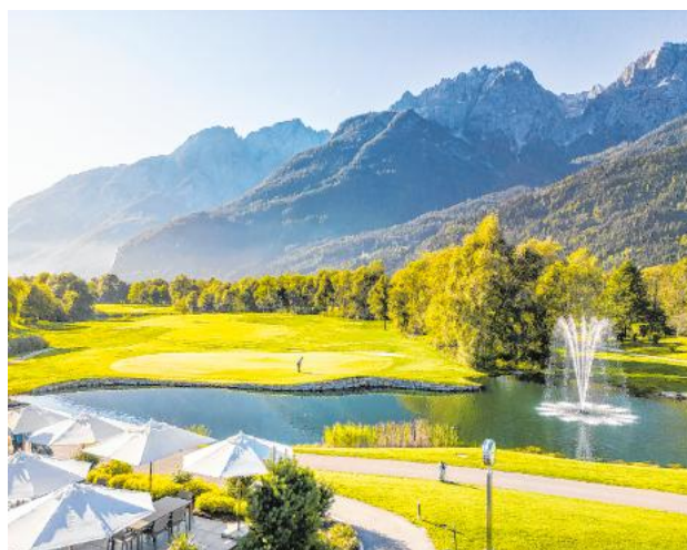
Der Platz ist die einzige 36-Loch-Anlage Tirols.

Aktuell wird die Anlage im Rahmen eines mehrjährigen Investitionsprogramms weiterentwickelt.